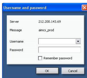
Слика 2 : Пријављивање у базу података

Корисничко име је фиксно док се лозинка може променити путем одговарајућег корисничког подешавања у Централној бази. Нова лозинка се састоји од најмање осам карактера, при чему најмање два карактера морају бити нумеричка. У случају, заборављеног/изгубљеног корисничког имена или лозинке, требало би контактирати Групу за обележавање и следљивост животиња, Управе за ветерину.