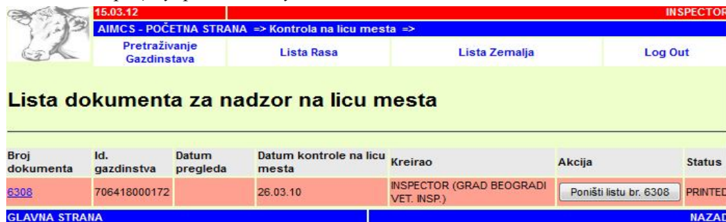
Слика 10: Процесуирање статуса имања

Сада се сви налази на газдинству могу унети у базу података у складу са редоследом појављивања у контролном обрасцу. Подаци се уносе на екран/дисплеј, а