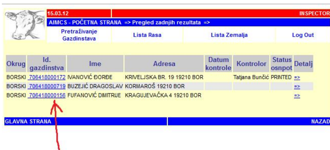
Слика 4: Приказ одабраних газдинстава

Комплетан преглед садржи и следеће податке: